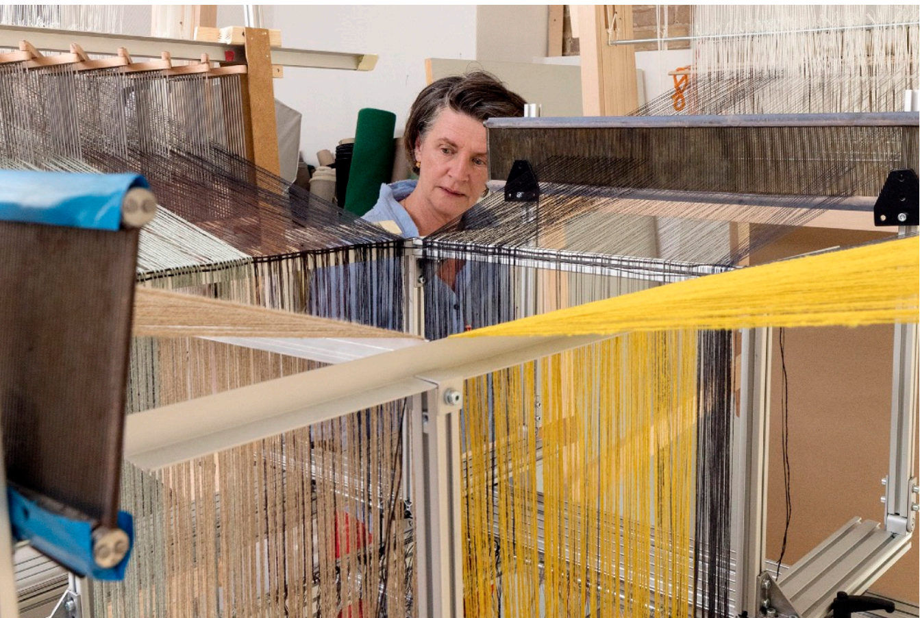
Métier à tisser sans couture