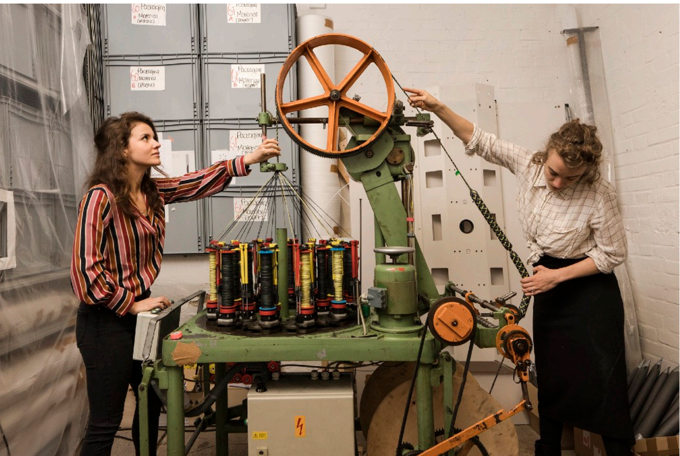
Recherches pour le métier Jacquard numérique