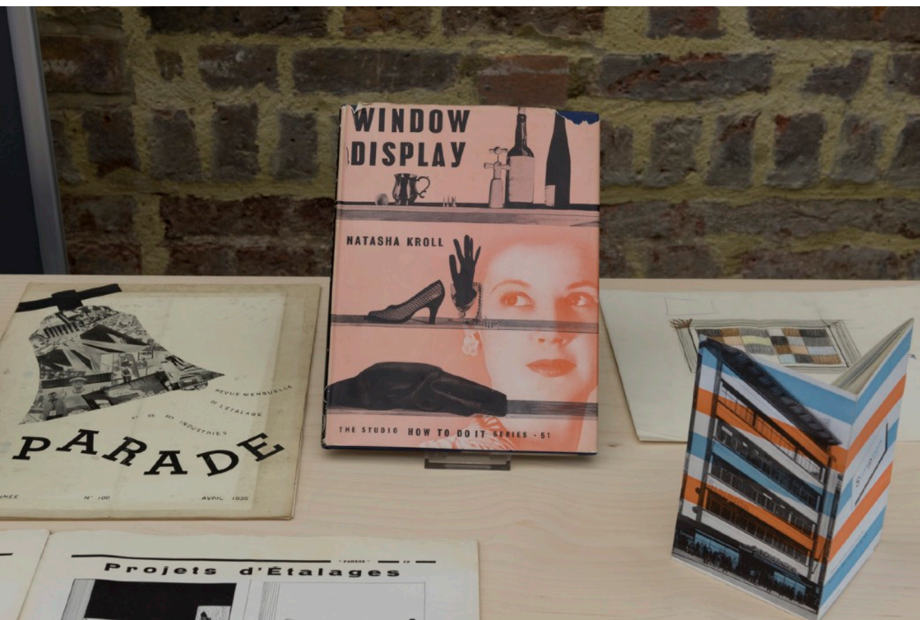
Atelier E.B, Passer-by Vue de l'exposition, Serpentine Sackler Gallery, Londres (3 octobre 2018 – 6 janvier 2019)