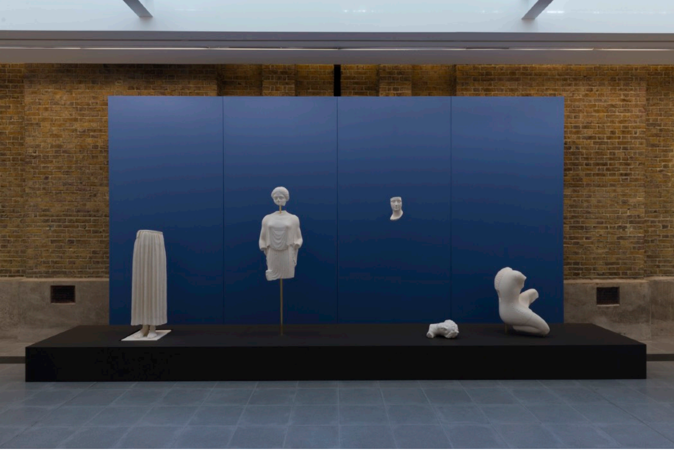
Atelier E.B, Passer-by Vue de l'exposition, Serpentine Sackler Gallery, Londres (3 octobre 2018 – 6 janvier 2019)