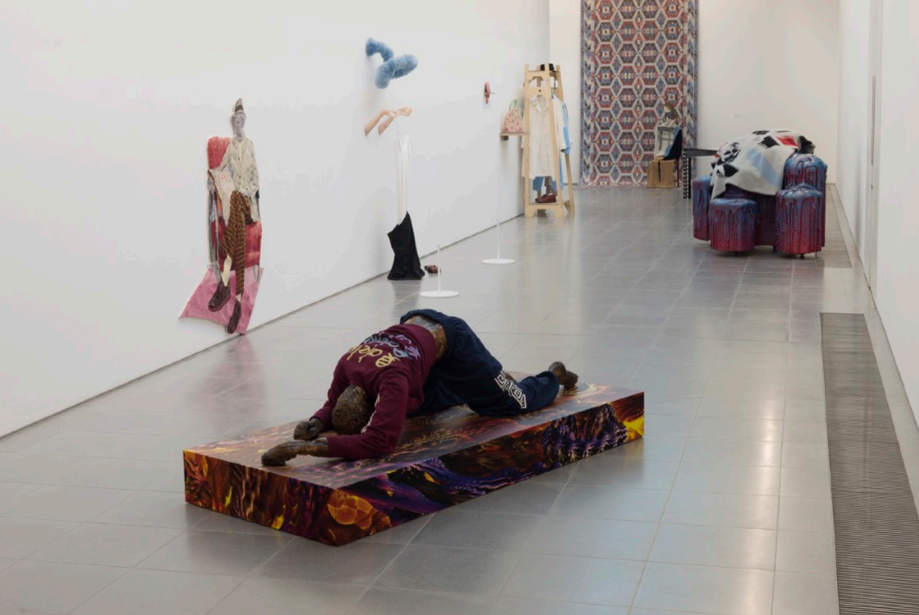
Atelier E.B, Passer-by Vue de l'exposition, Serpentine Sackler Gallery, Londres (3 octobre 2018 – 6 janvier 2019)