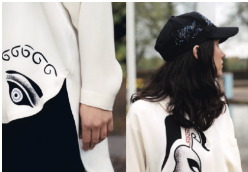
Jasperwear Collection, 2018/2019