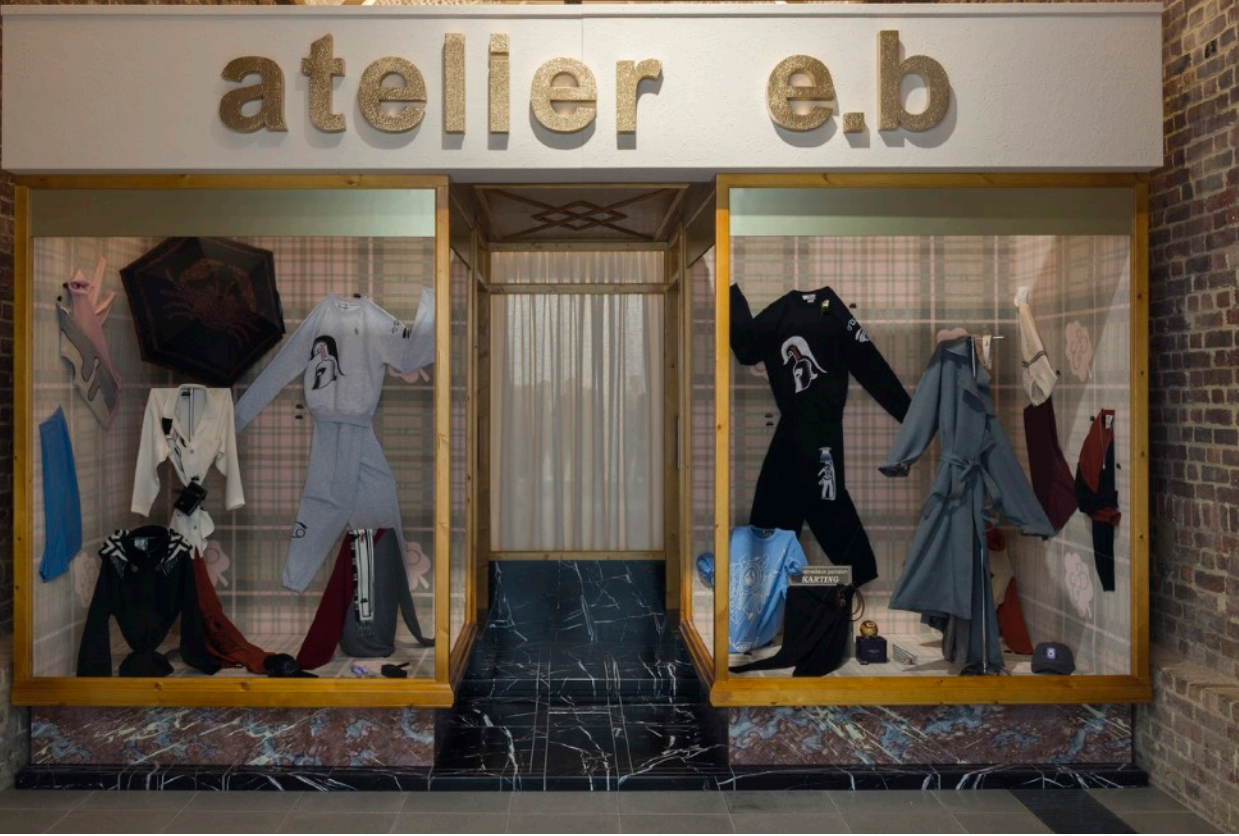
Atelier E.B, Passer-by Vue de l'exposition, Serpentine Sackler Gallery, Londres (3 octobre 2018 – 6 janvier 2019)