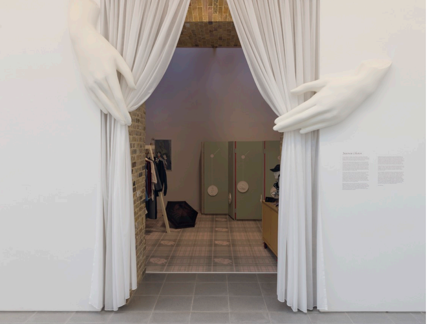
Atelier E.B, Passer-by Vue de l'exposition, Serpentine Sackler Gallery, Londres (3 octobre 2018 – 6 janvier 2019)